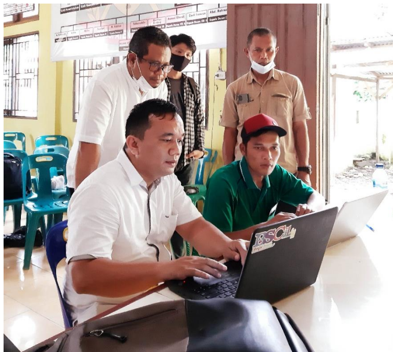
Gambar 4. Pelatihan dan Pembuatan website desa kepada perangkat desa