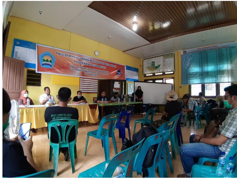
Gambar 5. Sosialisasi promosi desa kepada Masyarakat desa