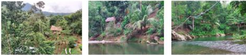
Gambar 2. Foto Kondisi Alam di Desa Timbang Lawan

Hal ini juga membuat kurangnya pemahaman teknologi informasi pada masyarakat dan perangkat desa sehingga promosi objek wisata yang dilakukan hanya menggunakan informasi dari orang ke orang, selebaran dan spanduk oleh pelaku wisata di desa Timbang Lawan. Kurangnya informasi yang didapatkan oleh masyarakat luas terhadap objek-objek wisata di Desa Timbang Lawan menyebabkan lambatnya pertumbuhan perekonomian pada Desa Timbang Lawan terutama dari sektor pariwisata. Hal ini dikarenakan belum adanya media informasi yang belum optimal secara luas dikarenakan masih menggunakan cara-cara yang konvensional. Kondisi ini perlu diubah dengan menggunakan media digital untuk lebih luas dapat menjangkau masyarakat di luar Kab. Langkat bahkan di luar Prov. Sumatera Utara seperti pembuatan website desa, media sosial, dan media elektronik lainnya