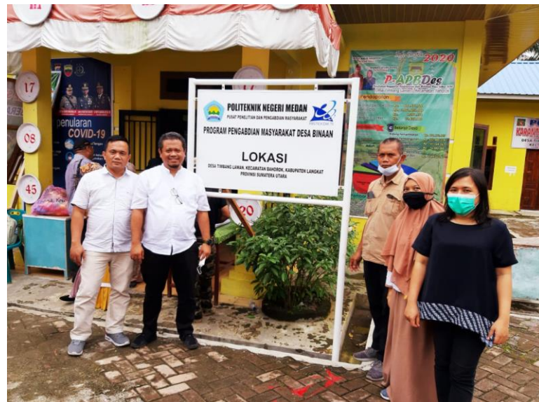
Gambar 6. Tim pelaksana kegiatan pengabdian kepada masyarakat